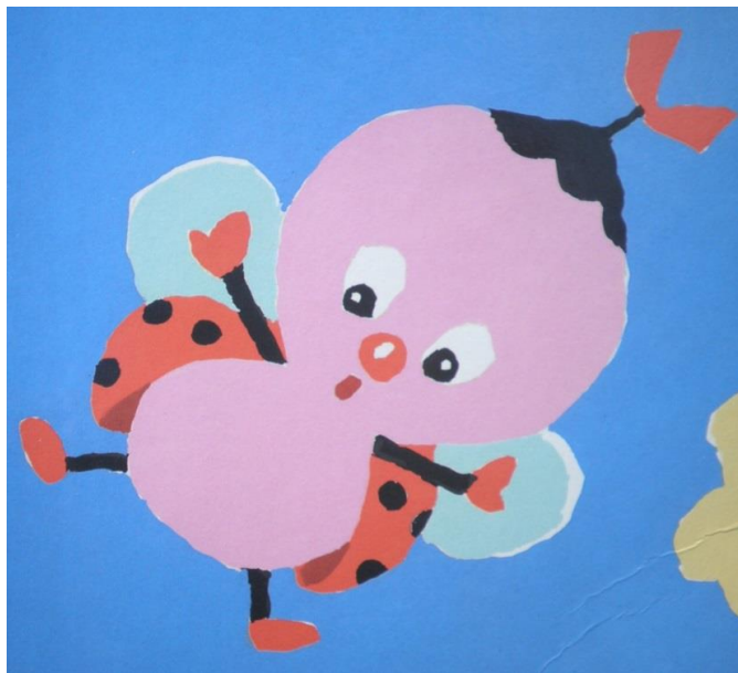
Illustration modifiée (la joie) :