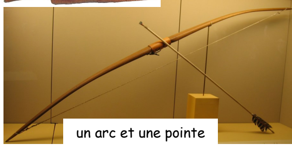
un arc et une pointe de flèche en silex