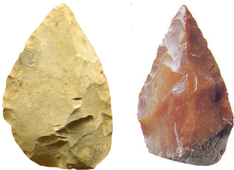
Des bifaces (fabriqués par les premiers homo erectus)

Les premiers homo erectus ont amélioré la taille du galet aménagé, et ils ont créé le biface : c'est un galet taillé sur ses deux faces, avec deux bords tranchants et un bout pointu.