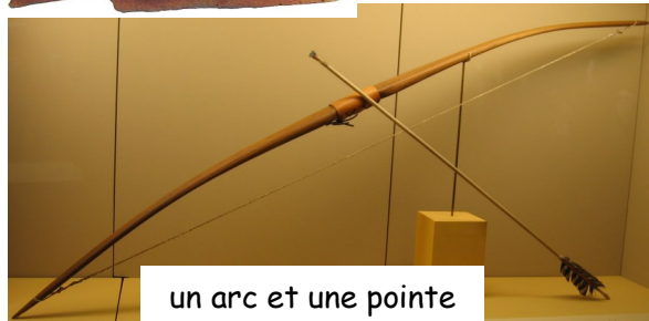
un arc et une pointe de flèche en silex