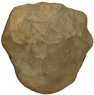
Un galet aménagé (fabriqué par l'homo habilis)

Les galets aménagés sont des pierres coupantes obtenues en frappant des galets l'un contre l'autre, pour faire sauter des éclats et obtenir un bord coupant.