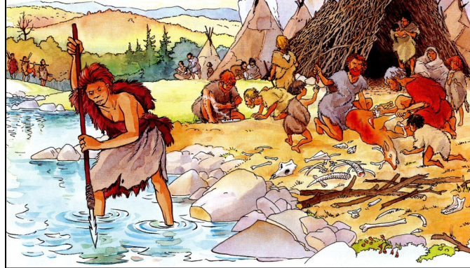
La reconstitution d'une scène de vie du Paléolithique