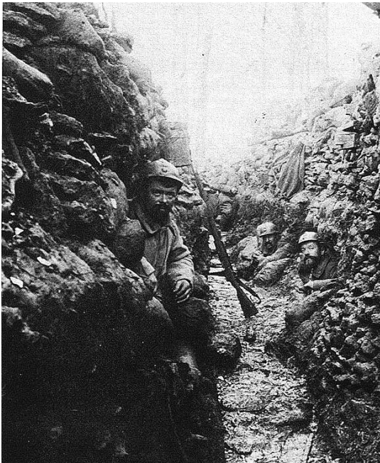
Les "Poilus" dans la tranchée.

Les premiers chars arrivent. Leur nom de code est "tank", ce qui veut dire réservoir en anglais. C'est l'une des nouvelles armes, avec l'aviation, qui apparaît au cours de cette guerre.