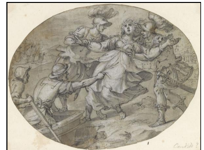
L'enlèvement d'Hélène par Pâris

Le prince troyen Pâris avait enlevé Hélène, la femme du roi des Grecs Ménélas, et l'avait ramenée à Troie. Ménélas, pour se venger des Troyens, demanda l'aide de son frère Agamemnon et tous deux emmenèrent une armée aux portes de la ville de Troie, pour récupérer Hélène.