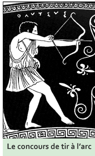
Le concours de tir à l'arc

Après dix ans d'un long et périlleux périple, Ulysse regagna enfin sa terre natale, pour y retrouver sa femme Pénélope et son fils Télémaque. Déguisé en mendiant, il pénétra dans le palais. Il constata que des prétendants voulaient contraindre Pénélope à choisir l'un d'eux pour l'épouser. Sortant son arc, Ulysse les défia dans un concours de tir à l'arc, qu'il remporta. Il exécuta ensuite tous les prétendants.