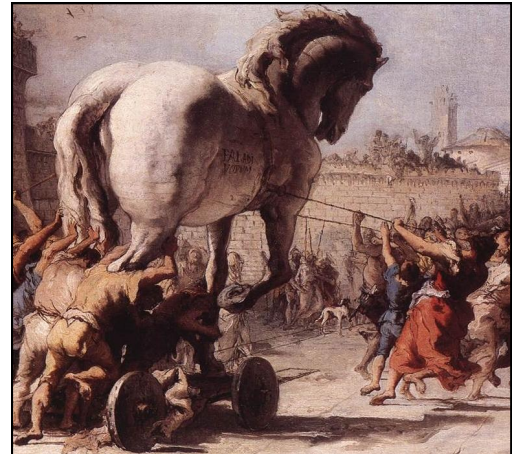
Le cheval de Troie, 1710.

Ulysse imagina de construire un cheval immense dans lequel se cachèrent des soldats grecs. Il offrit ce cheval aux Troyens, en leur faisant croire qu'il s'agissait d'un cadeau pour signer la paix. Les Troyens ouvrirent les portes de leur ville pour laisser pénétrer le cheval, ce qui permit aux soldats grecs de s'introduire dans Troie et de la détruire.